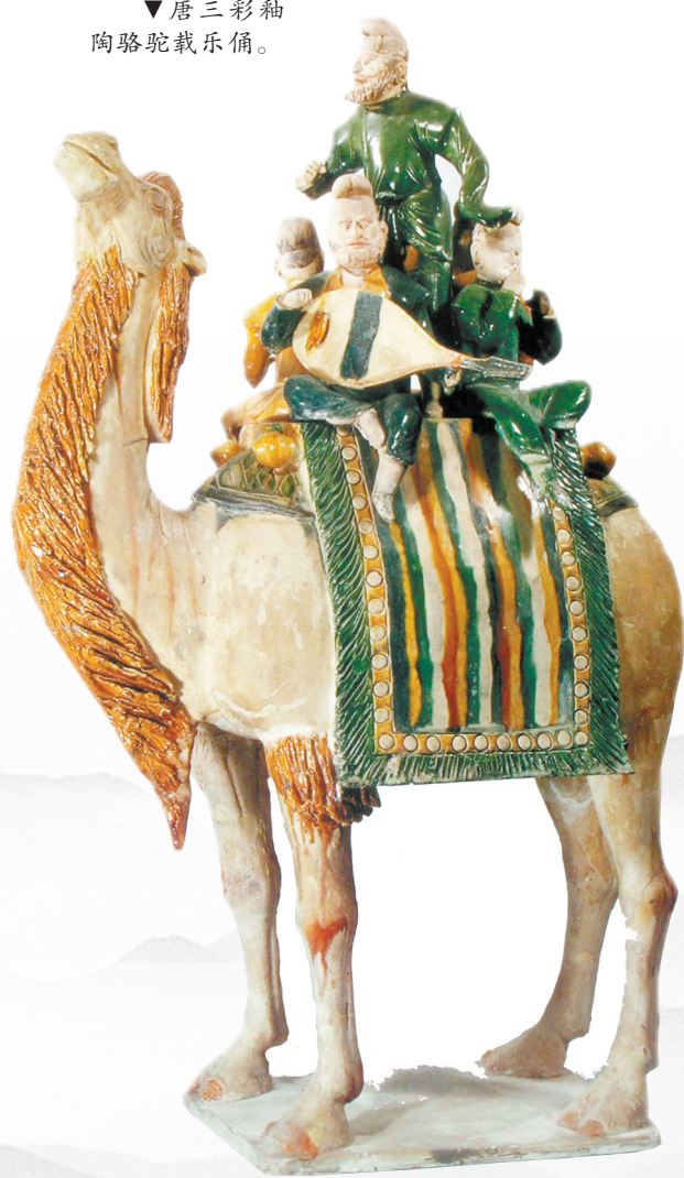
唐三彩陶骆驼载乐俑。