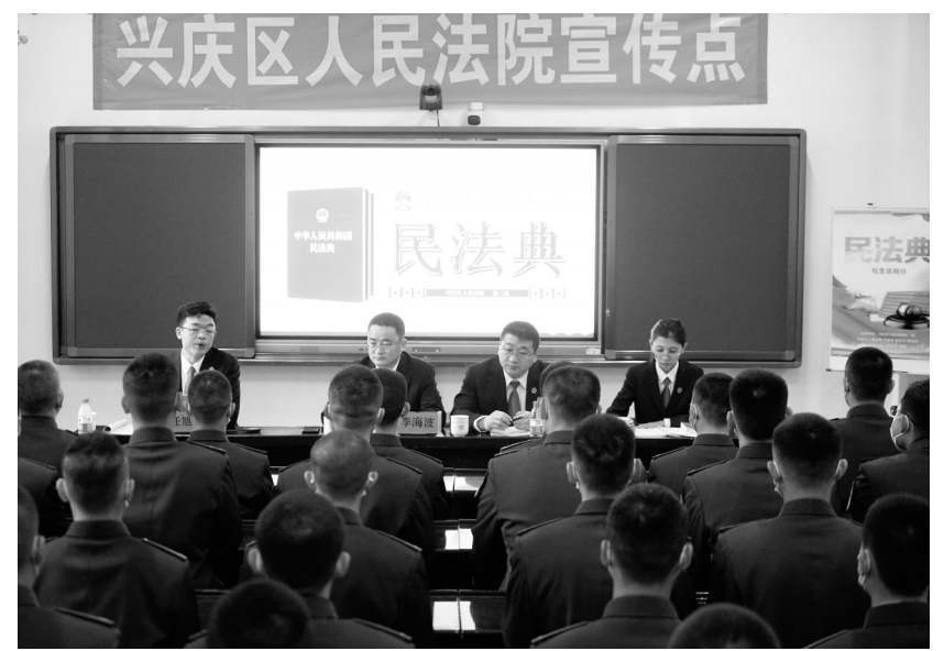
近日,银川市兴庆区法院深入武警宁夏总队银川支队开展民法典普法宣讲活动,让法治信仰根植于官兵心中,形成自觉守法的氛围,共建法治军营。

今年,西夏区将积极探索“互联网+人饮”新路径,加快城乡治水数字化、网络化、智能化进程。开展乡村治理示范创建,统筹推进乡村治理中心、新时代文明实践中心、农业农村综合服务中心建设,推行一站式接收、一揽子调处、全链条解决模式。全面推行“红黑榜”制度,持续推进乡村移风易俗,争创乡村治理示范镇。继续办好“一村一年一事”,补齐乡村建设短板弱项。深入分析研究当前制约西夏区农民增收的关键因素,千方百计补齐农民增收短板,建立健全联农带农机制,加强农业技能服务和组织劳务输出,增加就业岗位,及时兑付各类政策性补贴。