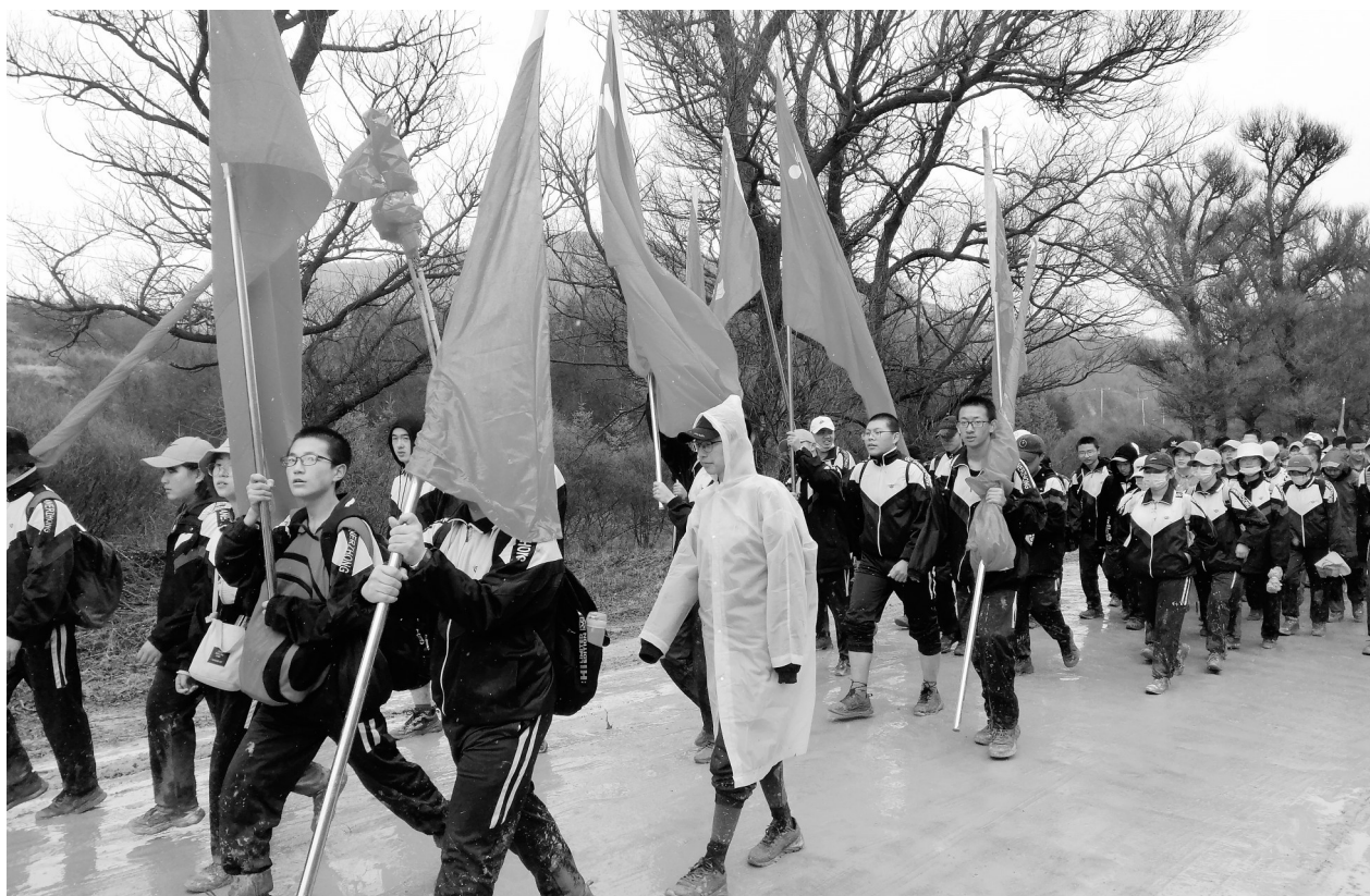
日前,固原市弘文中学和固原市第二中学的2000余名师生从学校出发,冒着雨雪、踏着泥泞的道路,徒步前往彭阳县古城镇任山河烈士陵园扫墓。从1995年开始,固原弘文中学每届新生在清明节前后便有这场特殊的仪式,一直延续至今。一届又一届的新生们,一天之内徒步54公里从学校往返任山河烈士陵园,用这种方式缅怀烈士们,这份坚定与执着已经延续了26年。

本报讯 近日,国网中卫供电公司共产党员服务队走进春耕,助力农民生产用电安全可靠。据了解,为保障大棚蔬菜用电需求,服务队每到一个大棚内,就向大棚负责人和棚内工作人员讲解用电安全常识、发放安全用电宣传册,并实施安全维护。对辖区内10千伏线路和供电设备进行全面的检修和消缺,并对配变、配电箱、控制开关的紧固螺栓进行检查、紧固,确保了辖区内灌溉设备以健康状态迎接负荷高峰,全力以赴保证春耕灌溉的安全可靠用电。(王斌)